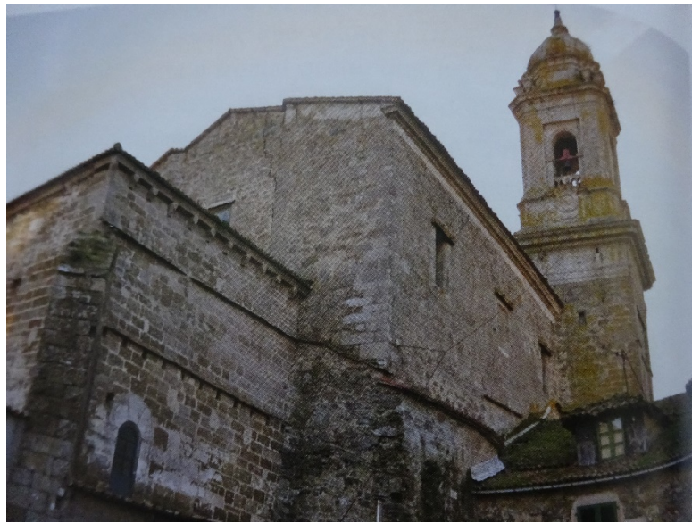
Zona onde se ubicaba o claustro do Convento, e vista do tellado da casa reitoral.

Si, aniñaban no meu interior en dúas zonas, nos recodos dos chanzos, fornelas e vans do corpo de escaleiras, pero fundamentalmente nunha cámara a modo de pombal existente no remate da miña figura, no espazo existente no intradorso da cúpula e do tambor. Para iso colocáronse sobre as pechinas unhas vigas e pontóns, para termar dun piso de táboas, e poder acubillar ás pombas, que entraban nese pombal a través dun amplo oco existente nunha das caras oitavadas do tambor, no extremo nordeste, e que se ve dende a Ronda da Coruña e dende o patio da reitoral, onde outrora estaba o meu fermoso claustro.