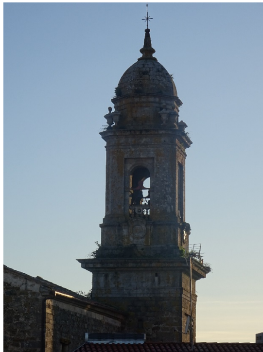
Vista da inclinación da torre cara ó noroeste

Pero..., agora dame certos reparos, e non pouca vergoña, dicir que teño unha certa “tara”, que me xera rubor, por non dicir pudor confesar, e é que estou bastante inclinada ou torta cara ó Noroeste, feito que doadamente se pode comprobar se miras pra min dende Sabián, Camiño das Cabadas, ou dende a Praza do Instituto. As causas que se levan barallado foron varias, pero “vaiche boa-vilaboa”, quen acorda tal cousa.