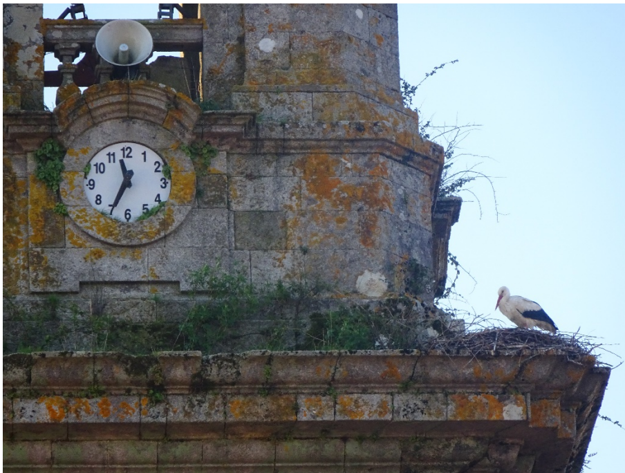
Esfera de reloxo no lado norte da torre, e niño de cegoñas.

certamente tamén algo farto polos problemas que o reloxo estaba a dar frecuentemente, decide que era mellor a instalación dun mecanismo electrónico de precisión, sendo sufragado, creo recordar, mediante unha xenerosa aportación dun particular. Pois así foi, baixouse o vello reloxo do caseto de madeira, que logo tamén suprimiron, instalaron dúas esferas nos exteriores da torre, nuns óculos circulares que xa estaban concibidos para iso e, aínda que conta con catro ocos para tal función, unicamente instalaron esferas nos laterais sur (cara a Praza do Convento), e outro cara o norte. Tamén mecanizaron os sistemas de percusión das campás, trocando os badais por un sistema de electromazos de activación a distancia, e tamén mandaron “para ó faiado” á vella e moi pesada marra ou martillón que batía contra a campá grande, “a das horas”, que ía accionada mediante un sistema de articulacións de ferro que movían os engranaxes e piñóns do vello reloxo.