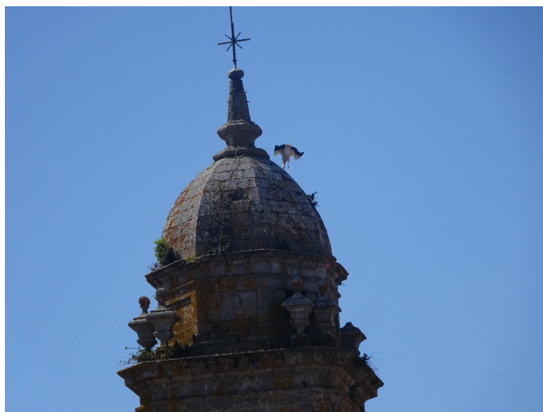
Tambor e cúpula ochavados de remate da torre, cunha cegoña pousada nela.

Agora, cambiando de tema, vouvos falar das miñas orixes, ¡Tempo ha, xa che fai ben anións!. Creo que xa vos dixen que antes de min houbo outra, e se non volo dixen xa, agora me poño con elo. Esa torre vella, coa que non cheguei a cadrar, seica era coma a dun castelo, diso falan os papeis vellos, e seica tíñache dous escudos dos Ulloa e un dos Mendoza, ¡iso polo menos!. Pero, ¿sabedes que?. Tíñavos unha cousa aínda máis curiosa, e era que en vez de estar cuberta por unha cúpula coma min, estaba coroada por unhas almeas defensivas, con merlóns rematados en pico. Vese que daquelas éranche ben guerreantes, porque pensaban que había que defenderse ben. O mesmo deberon cavilar os que fixeron a Catedral de Tui, e tamén os “sanjuanistas” que fixeron a igrexa de San Xoán de Portomarín.