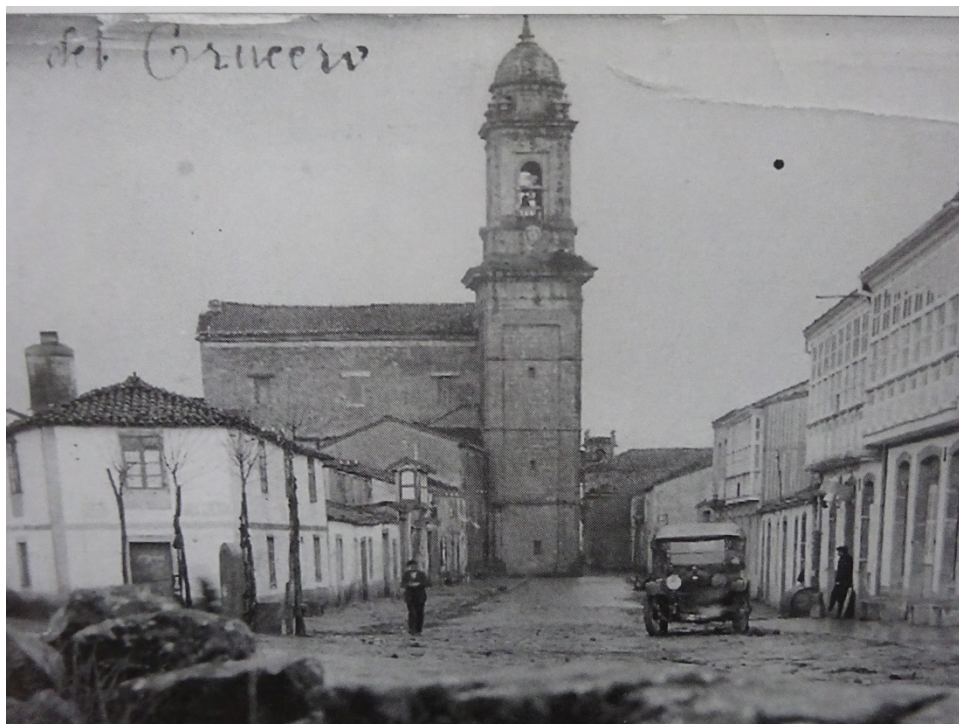
Vista da Torre do Convento. Foto de comezos do século XX