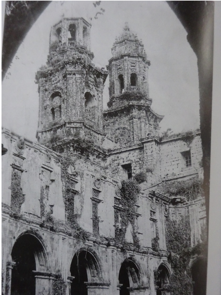
Vista das torres de Sobrado dos Monxes antes da restauración dos anos 60 do século XX.