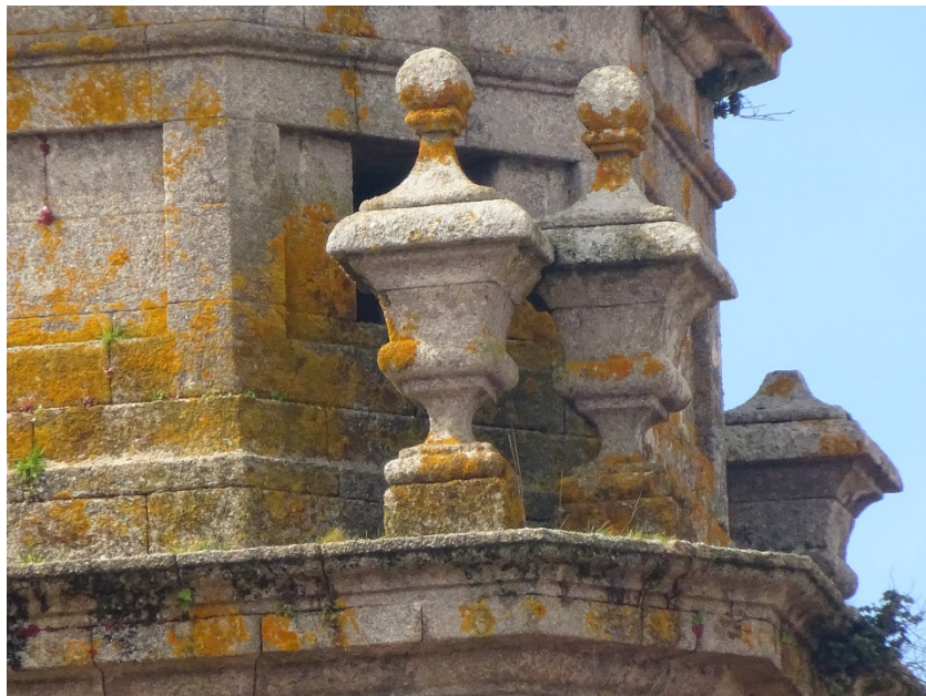
Oco de acceso ó pombal no intradorso do tambor da cúpula.